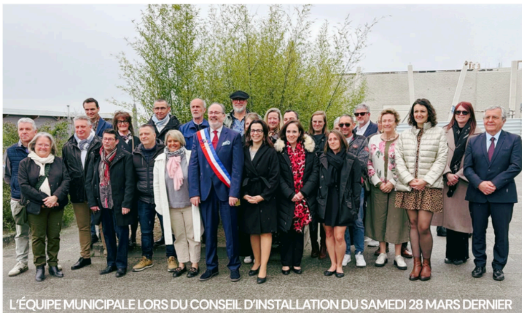
L'ÉQUIPE MUNICIPALE LORS DU CONSEIL D'INSTALLATION DU SAMEDI 28 MARS DERNIER

Voici déjà quelques semaines que la nouvelle équipe municipale a pris ses fonctions et s'est mise au travail avec enthousiasme. Les dossiers en cours ont été repris et les premiers rendez-vous s'enchaînent, faisant émerger progressivement les projets à venir.